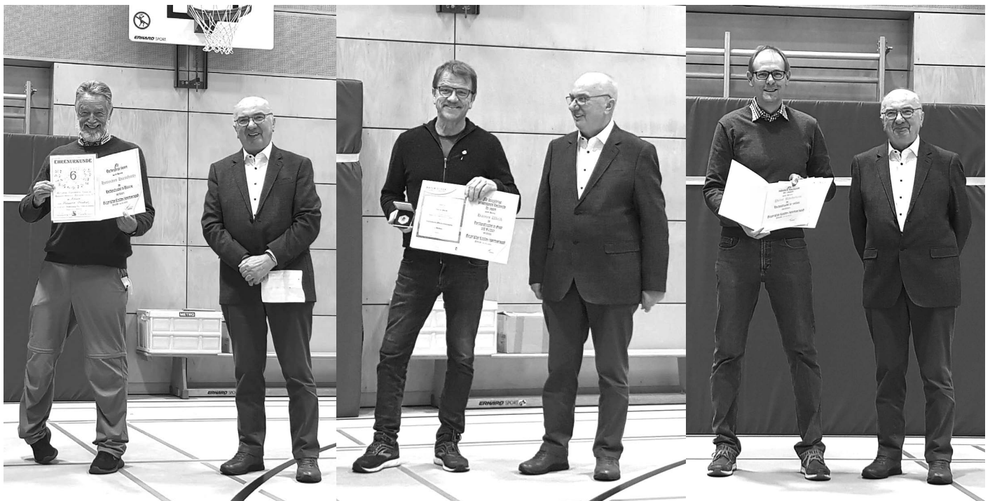
Michael Duttenhofer Text und Fotos